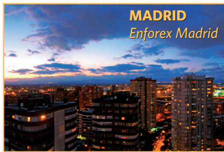
MADRID Enforex Madrid