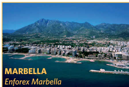
MARBELLA Enforex Marbella